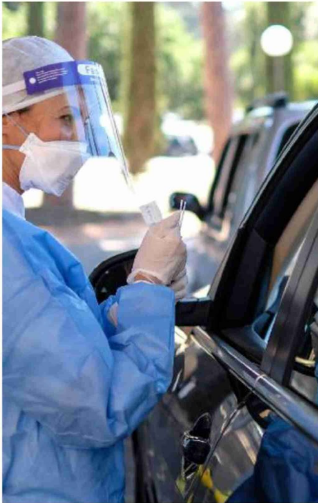
Un operatore sanitario esegue un tampone presso una Asl di Roma