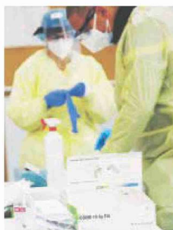
Primi test antigenici nelle scuole