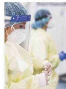
Test rapidi nelle scuole

Bassa la mortalità Antinfluenzale nelle zone dove L'allarme Gimbe ci si è vaccinati Scorte inadeguate per l'influenza per la popolazione