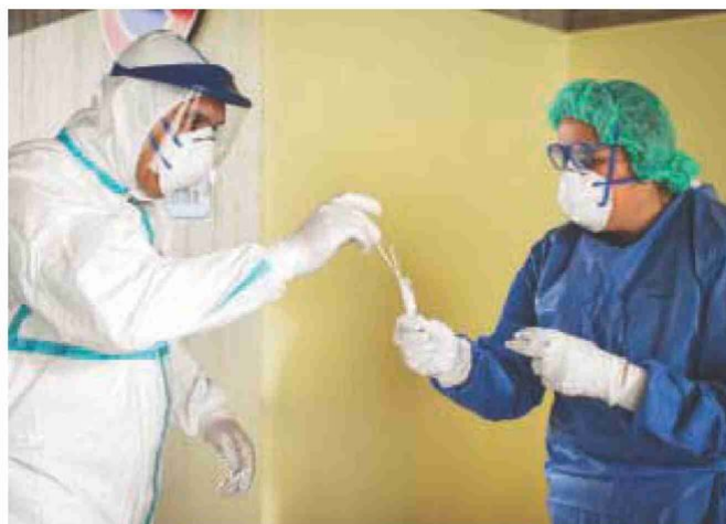
Operatori sanitari al lavoro su tamponi e lo scalo di Fiumicino

Amnesty: morti 7.000 operatori sanitari nel mondo