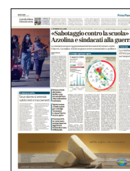
Peso: 2-70%, 3-14%

Speranza fa appello ai giovani «Voi avete sintomi debolissimi, ma pensate ai vostri genitori e nonni»