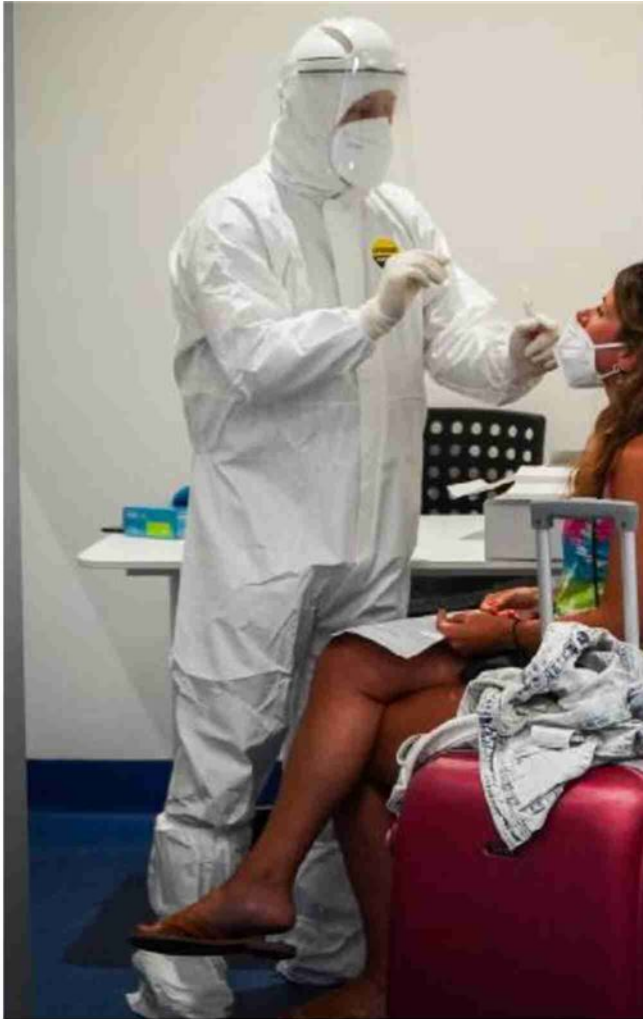
Un operatore sanitario effettua un tampone rinofaringeo