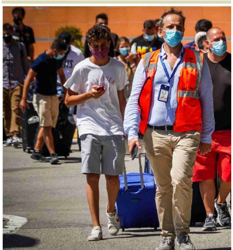
I passeggeri di un volo appena atterrato all'aeroporto napoletano di Capodichino si avviano ai controlli anti-Covid