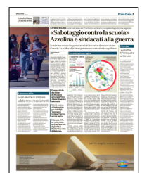
Peso: 2-70%, 3-14%