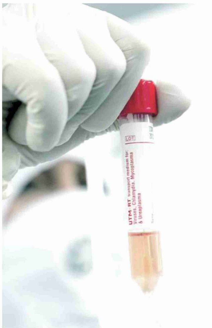
Una provetta con un tampone a Milano

PESANO I RIENTRI DALLE VACANZE MA SPAGNA E FRANCIA HANNO IL QUADRUPLO DELLE INFEZIONI