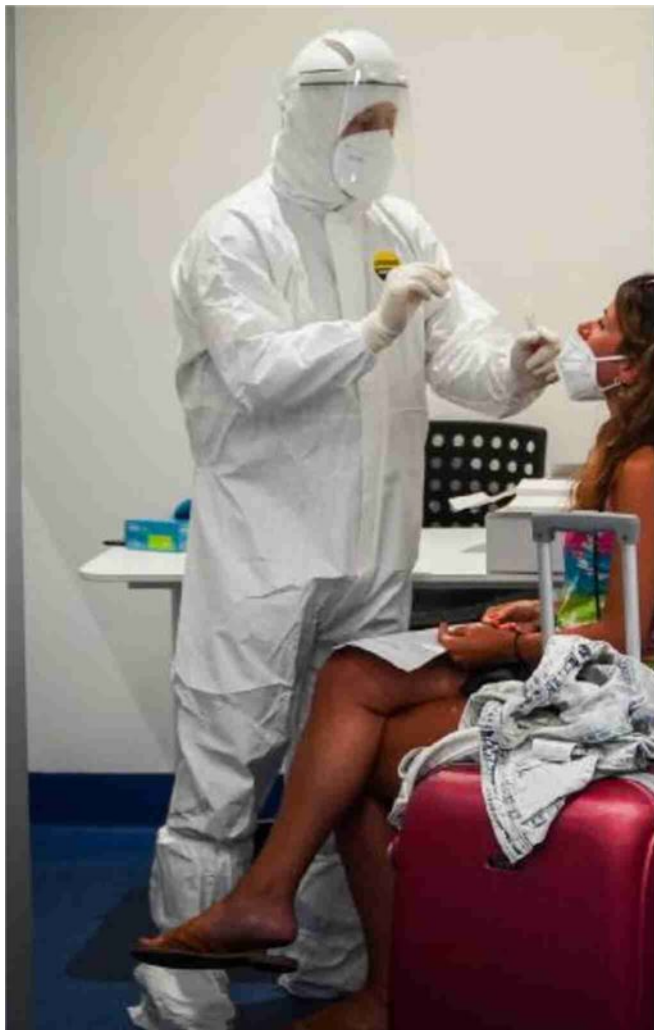
Un operatore sanitario effettua un tampone rinofaringeo