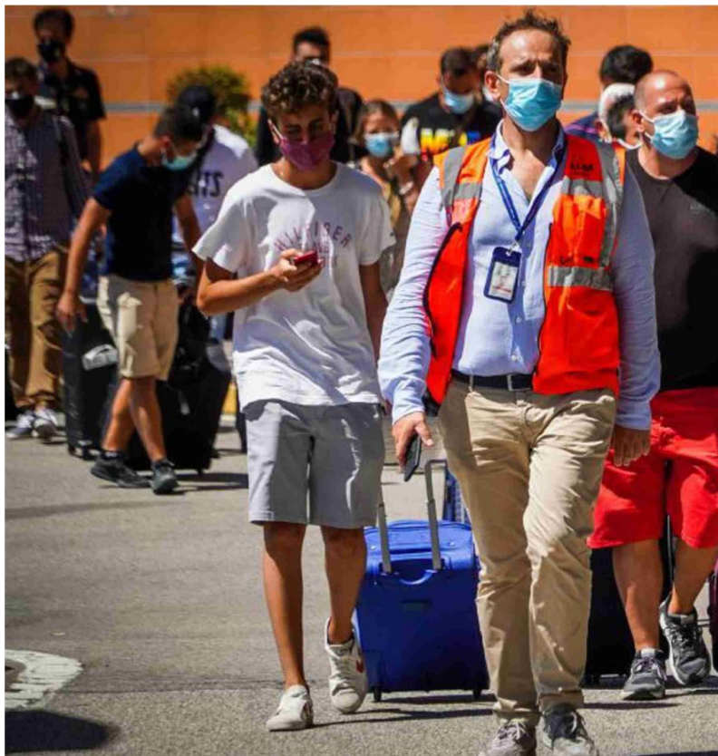
I passeggeri di un volo appena atterrato all'aeroporto napoletano di Capodichino si avviano ai controlli anti-Covid