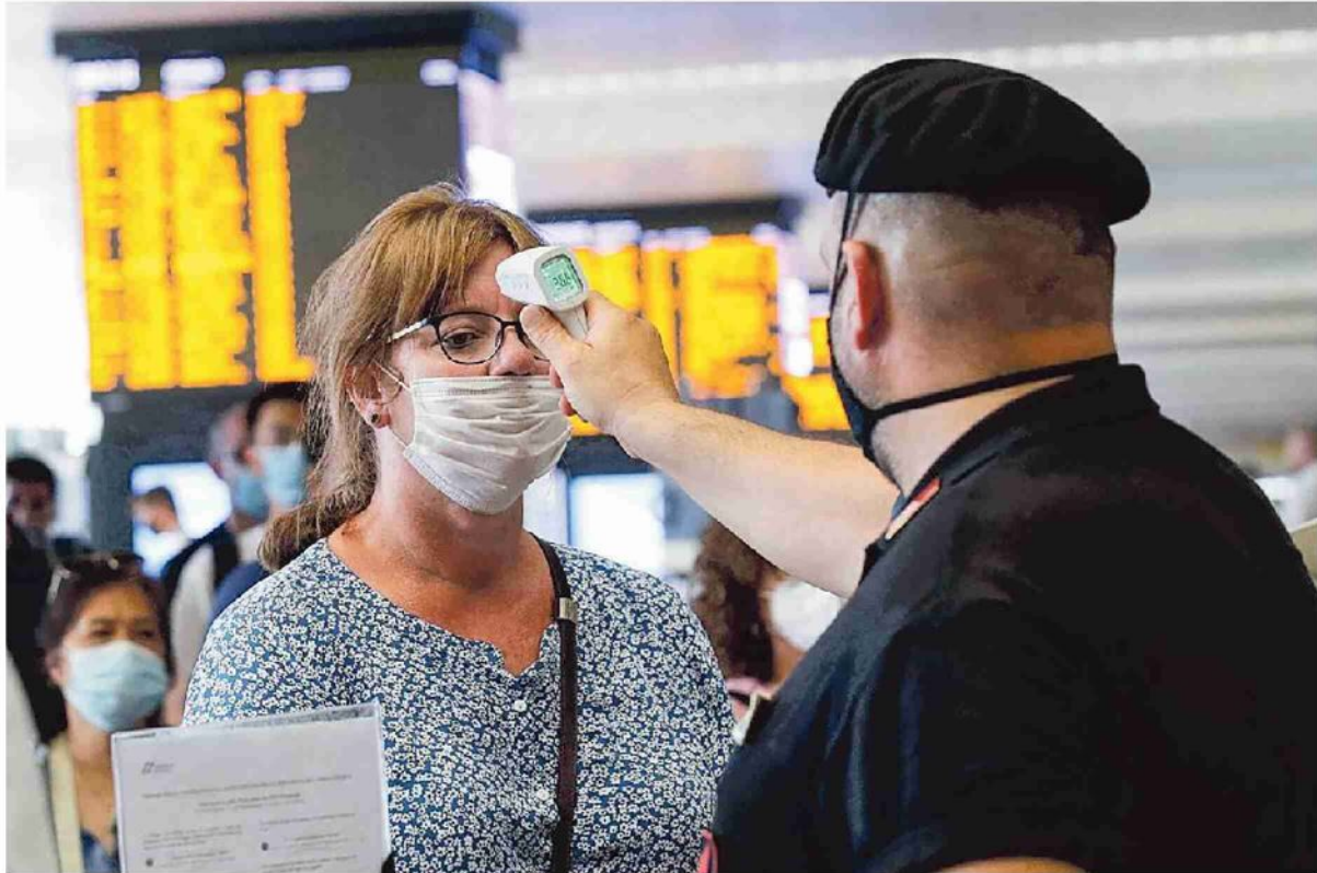
Controlli anti-Covid alla stazione ferroviaria di Roma Termini