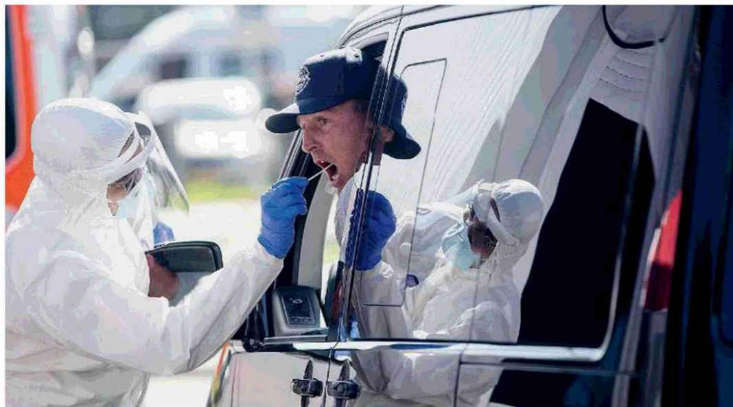
Tamponi. Ieri in Lombardia ne sono stati fatti oltre 11mila