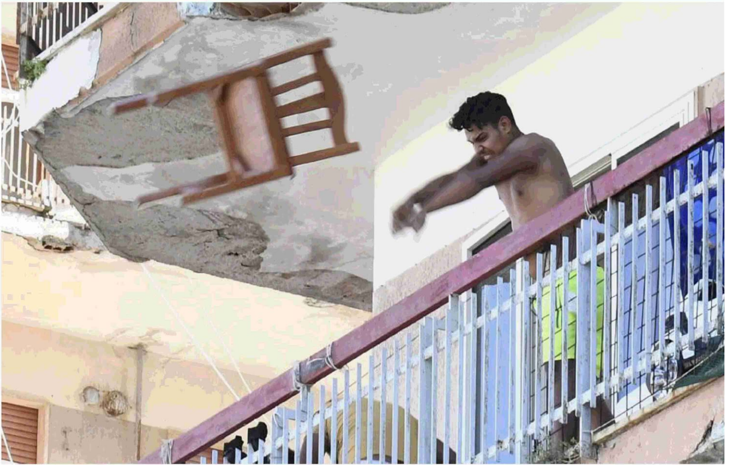
La rabbia degli abitanti dei palazzi dove sono scoppiati i focolai con il lancio di sedie e oggetti vari dai balconi