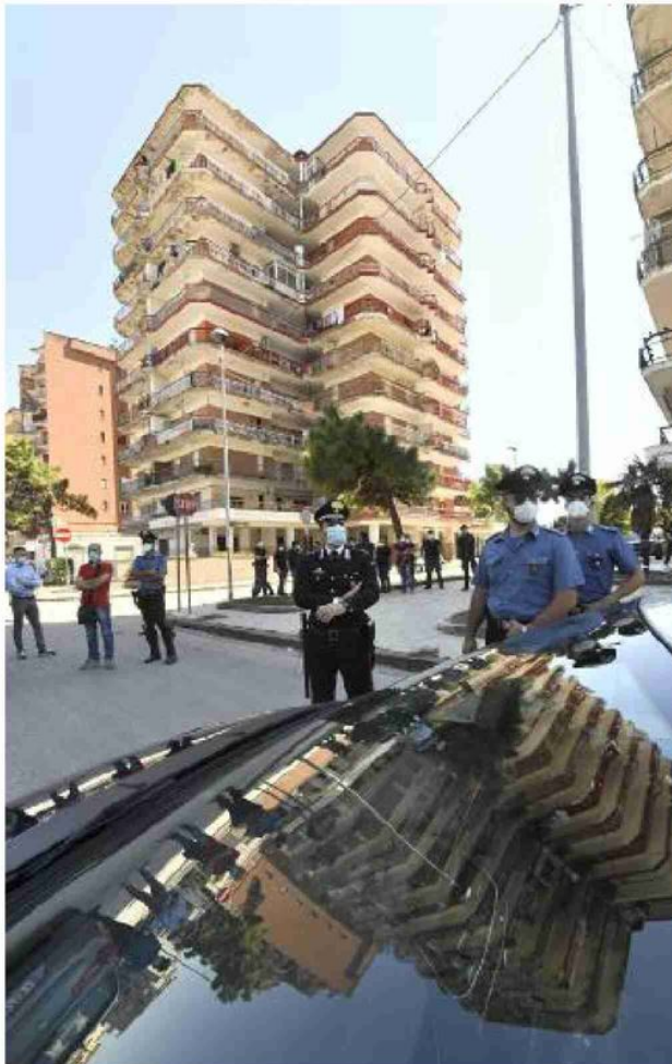
I palazzi ex Cirio presidiati dai carabinieri a Mondragone, Caserta