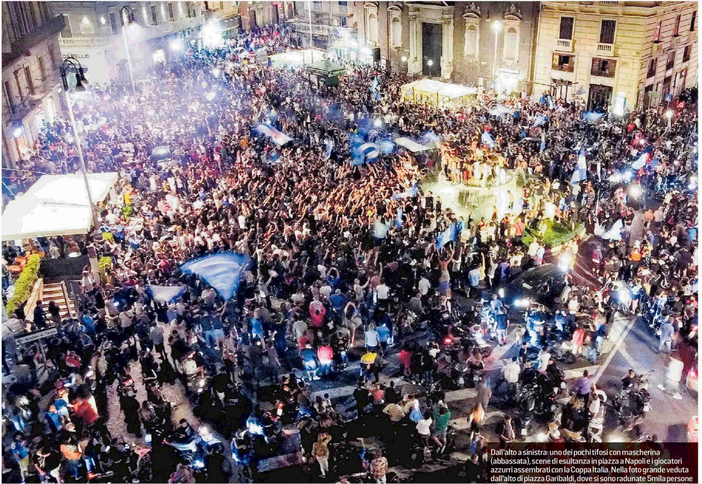
Dall'alto a sinistra: uno dei pochi tifosi con mascherina (abbassata), scene di esultanza in piazza a Napoli e i giocatori azzurri assembrati con la Coppa Italia. Nella foto grande veduta dall'alto di piazza Garibaldi, dove si sono radunate 5mila persone