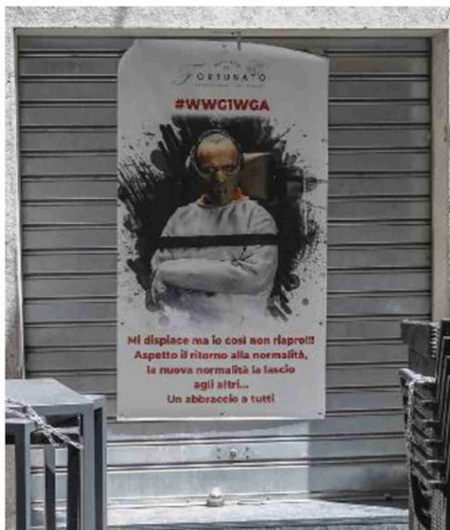
Manifesto di protesta sulla saracinesca di un ristorante romano