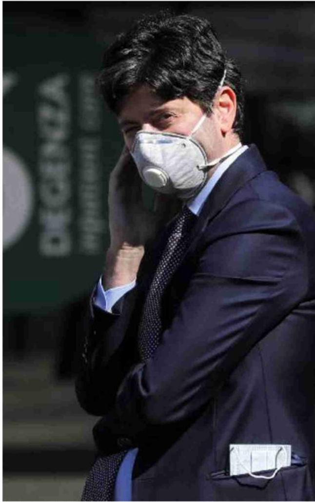
Il ministro della Salute, Roberto Speranza