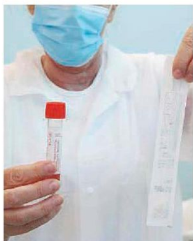
Ogni giorno 70mila tamponi il numero dei test crescerà ancora

tamponi diagnostici, chiedendo al Ministero della Salute di inserire tra gli indicatori di monitoraggio della fase 2 un minimo di almeno 250 tamponi diagnostici al giorno per 100.000 abitanti». E sul tema è tornato anche Borrelli indicando che il problema è stato risolto e che i tamponi vanno fatti con priorità a sanitari, pazienti ospedalizzati e a coloro i quali hanno sintomi come stabiliscono le linee guida dell'Oms.