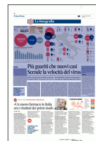
Peso: 1-2%, 12-53%