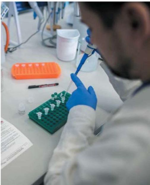
Un laboratorio di ricerca

fa su Wuhan e la provincia di Hubei, epicentro dell'epidemia, - afferma - la percentuale è del 3%. Se invece si guarda al resto della Cina la percentuale scende al 4 per mille. Numero uguale per il resto del mondo». Intanto anche il Giappone rafforza le misure di protezione: da questa settimana saranno cancellati i voli diretti con Shanghai e altre città cinesi da 13 aeroporti regionali.