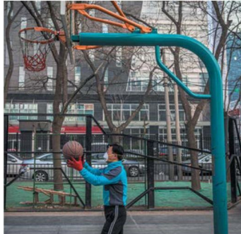
Un uomo gioca a basket a Pechino