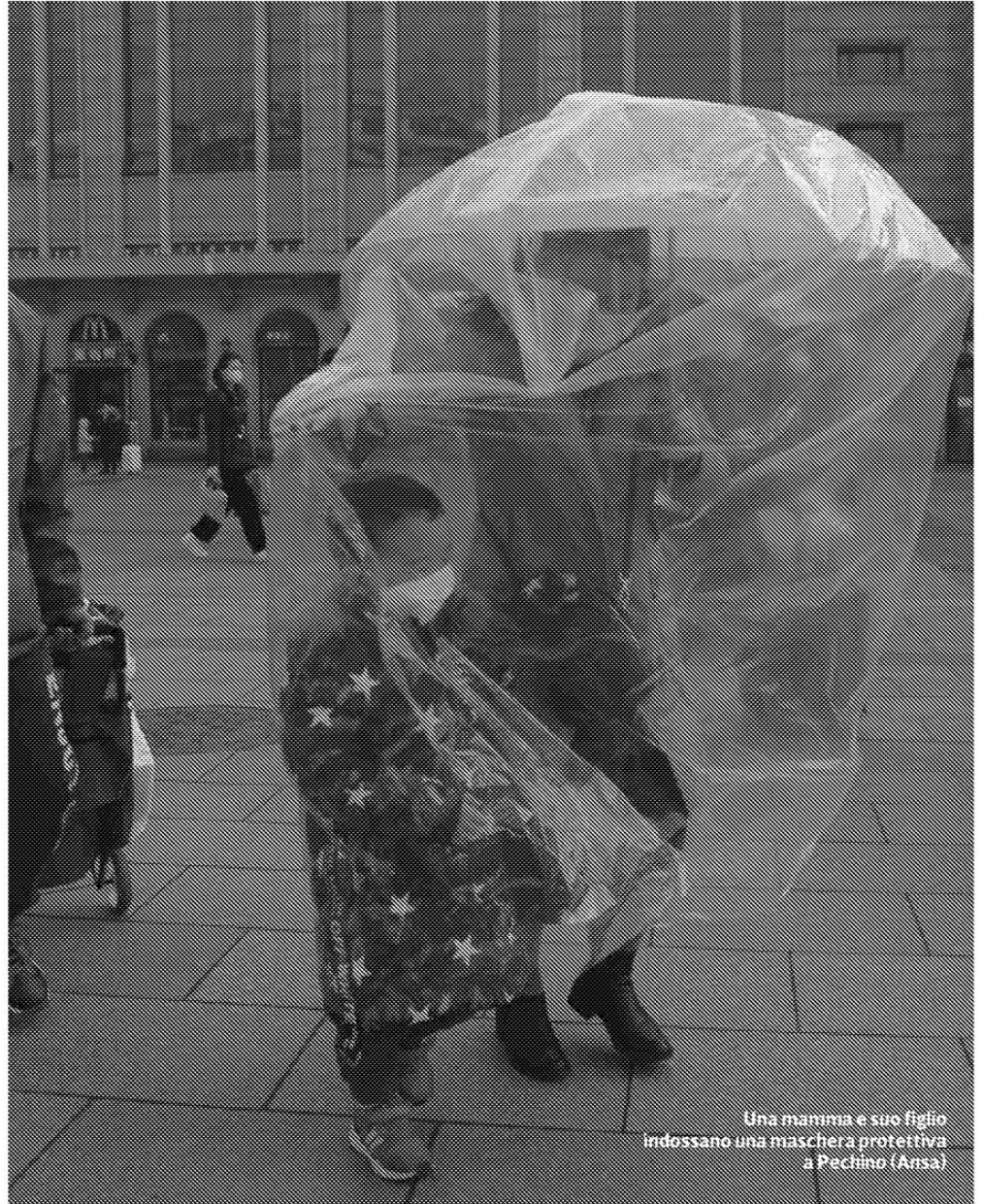
Una mamma e suo figlio indossano una maschera protettiva a Pechino