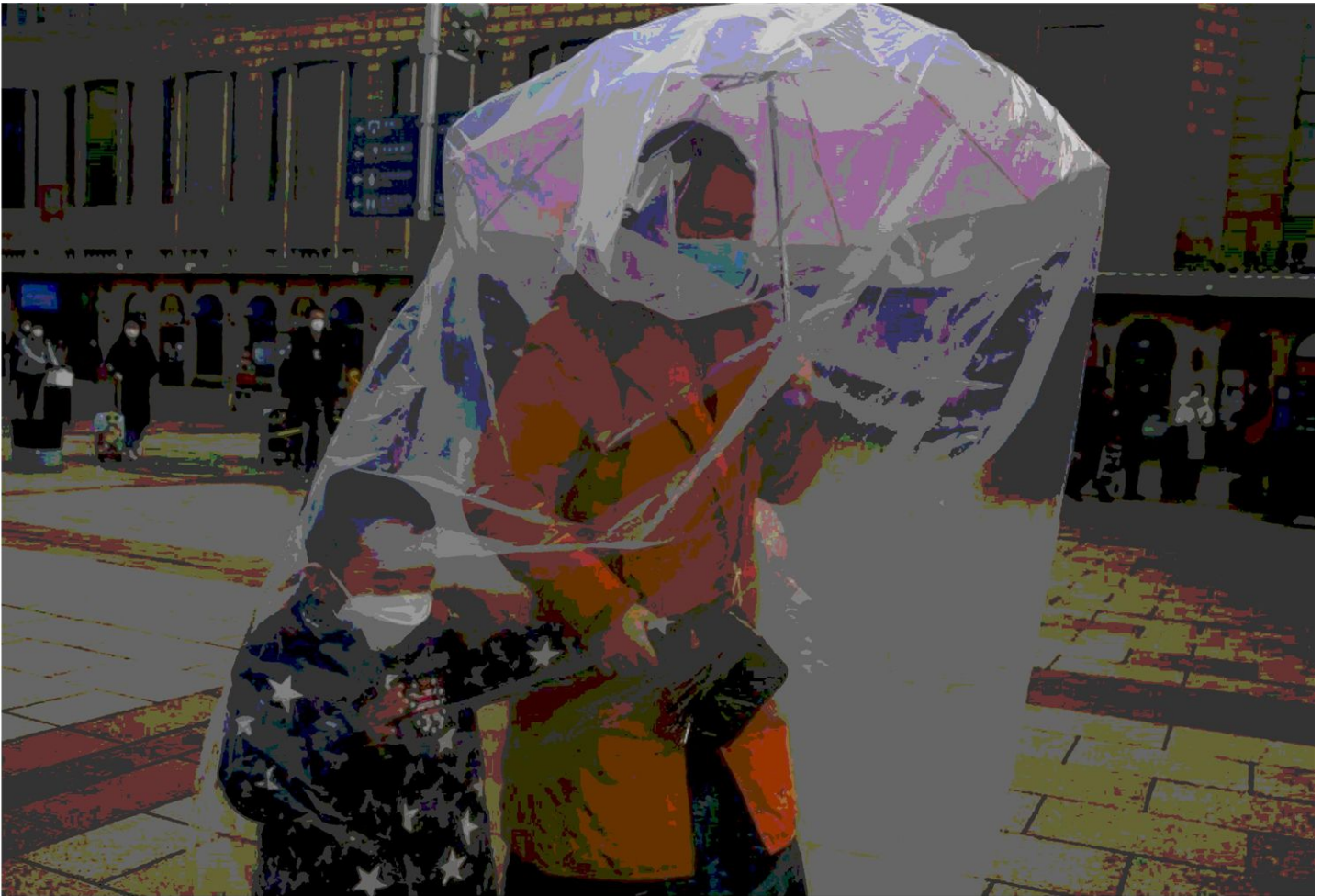
Una mamma e suo figlio indossano una maschera protettiva a Pechino