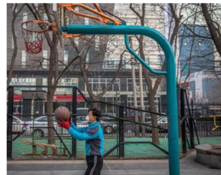
Un uomo gioca a basket a Pechino