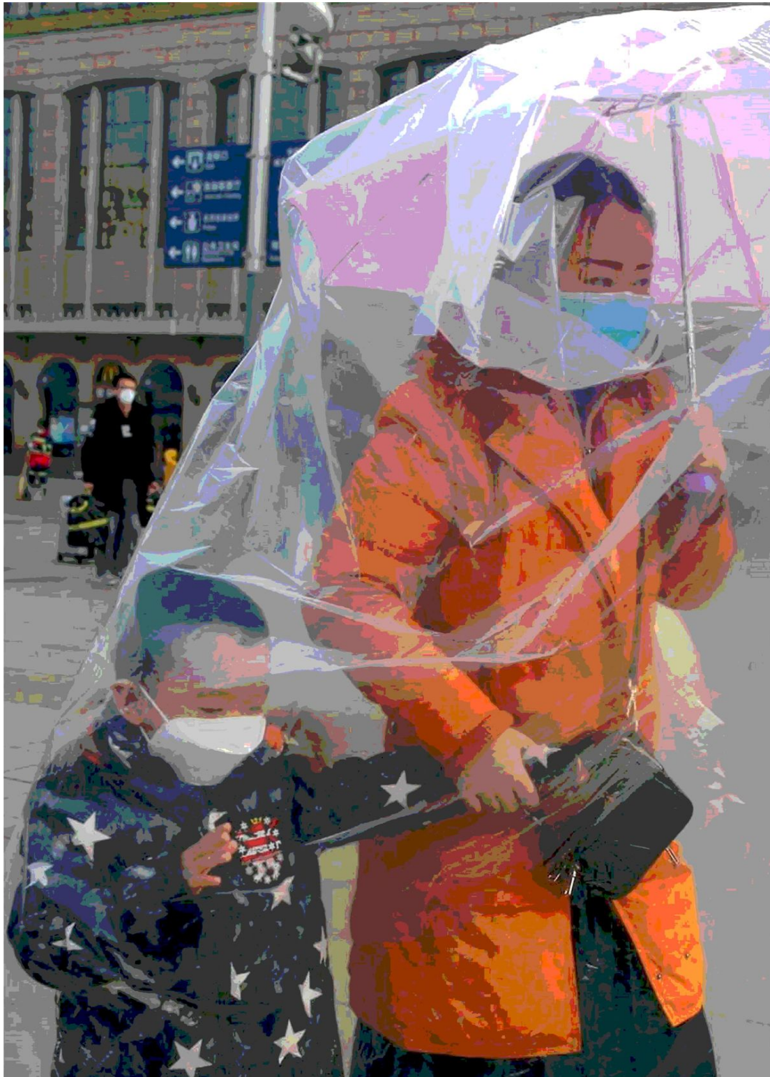
• Una mamma e suo figlio indossano una maschera protettiva a Pechino