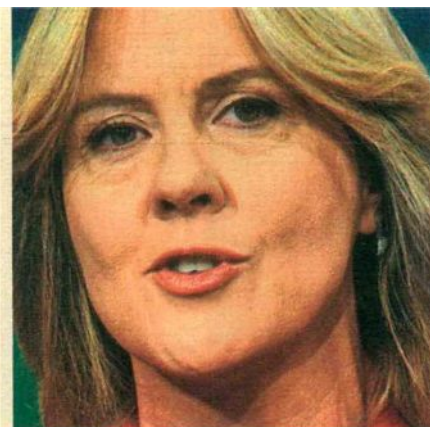
Beatrice Lorenzin, ex ministro della Salute.