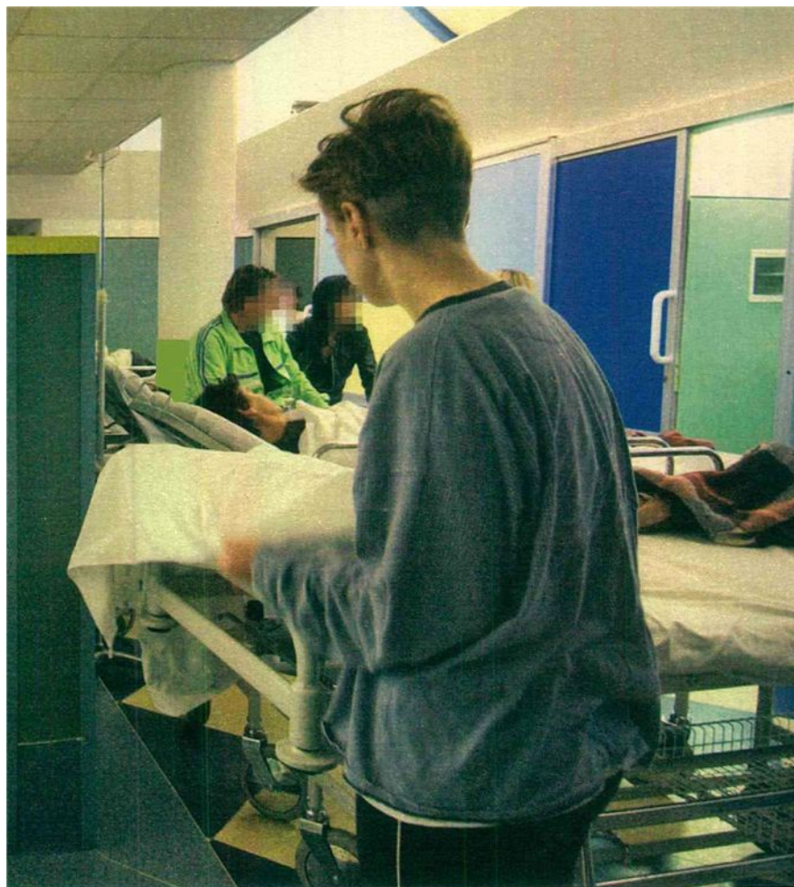
La situazione insostenibile nel pronto soccorso italiani, ingolfati di pazienti spesso anziani ed extracomunitari privi del medico di famiglia.